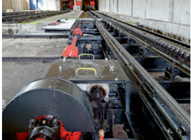
16 Solide Mechanik mit neuester Steuerung, Pilatus-Bahnen AG