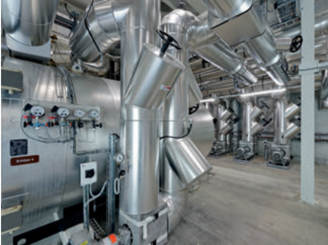
8 Nachhaltig und sicher Brötchen backen, Jowa AG